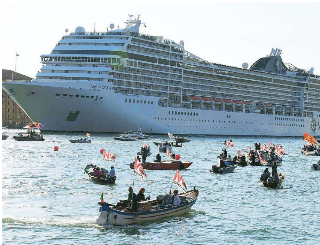
Il passaggio della Msc Musica, con le imbarcazioni di polizia che tengono lontane quelle dei manifestanti

di uova è un po' poco per aprire un procedimento penale e l'uso dei fucili ad acqua da spiaggia si commenta da solo. La Digos annuncia accertamenti e la visione dei filmati. Ma alla fine non si conta alcun contuso, tanto meno feriti e non ci sono state collisioni e nemmeno danni. La colonna sonora e i giochi per i bambini e per chi ha voluto pure mezzo bagno in canale, hanno fatto da cornice all'evento. —