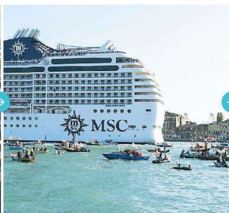
L'arrembaggio delle navi dei manifestanti alla Msc Musica, prima grande nave a passare