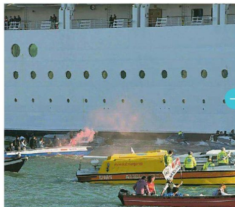
Il passaggio delle navi della parata vicino al bordo della grande nave di Msc Crociere