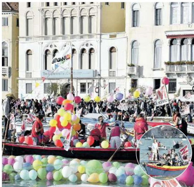
BARCHE COLORATE Le imbarcazioni agghindate con palloncini e festoni alle Zattere

TRA I MANIFESTANTI I CENTRI SOCIALI RIVOLTA E MORION MA ANCHE I "NO PFAS" DI TUTTO IL VENETO