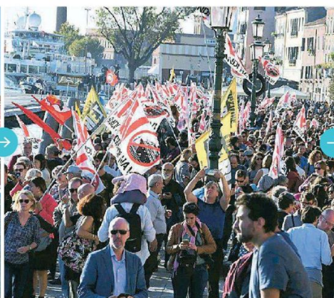
L'arrivo dei partecipanti i a piedi alle Zattere dove si è svolta la manifestazione dei No Navi