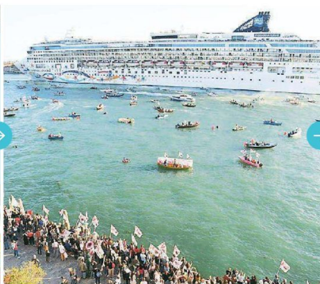
Una veduta complessiva del Bacino di San Marco con la nave "scortata" dalle altre barche