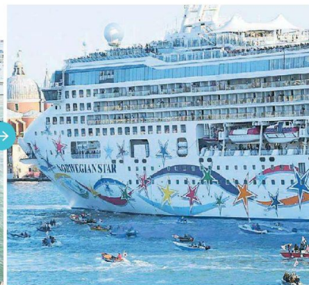
Il secondo "arrembaggio" della giornata di ieri quello alla Norwegian Star, seconda nave a passare