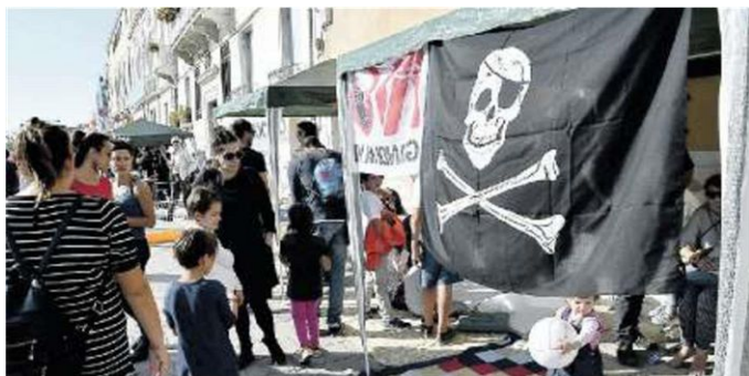
LA "TENDA DEI PIRATI" Lo spazio allestito alle Zattere per far giocare i bambini

PRESENZE DA TUTTA ITALIA PER SALDARE I MOVIMENTI CHE CONTESTANO LE GRANDI OPERE AMBIENTALISTI DALLA RIVIERA DEL BRENTA CON L'ASSOCIAZIONE "MALACAIGO" CONTRO L'INQUINAMENTO