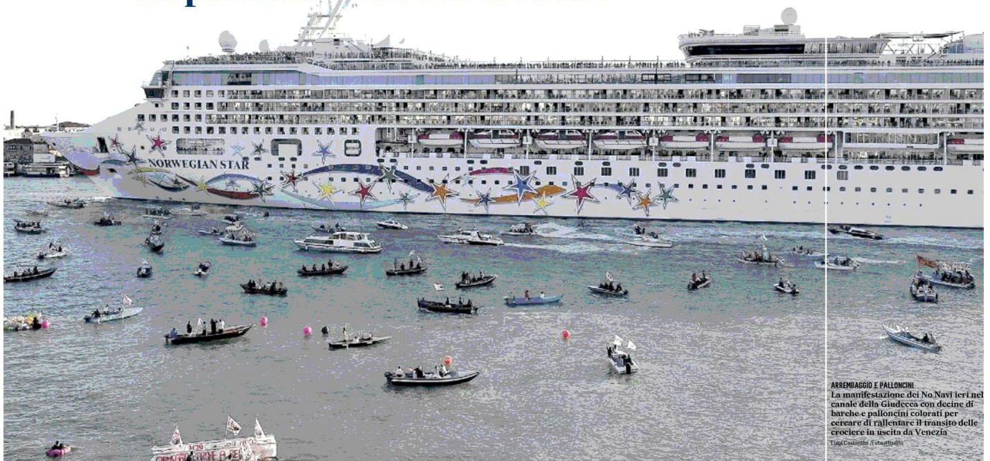
ARREMBAGGIO E PALLONCINI La manifestazione dei No Navi ieri nel canale della Giudecca con decine di barche e palloncini colorati per cercare di rallentare il transito delle crociere in uscita da Venezia