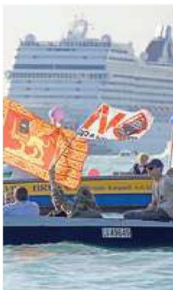
La protesta a Venezia

pubblicate sui social dal ministro alla Cultura Bonisoli e avallate dal ministro alle Infrastrutture Toninelli, sul tema delle grandi navi a Venezia e della gestione del porto lagunare. La storia di Venezia dovrebbe insegnare - aveva detto Santi - quanto sia inscindibile il legame tra il porto e la città, ma questo insegnamento non è neppure percepito. Due ministri dimostrano di non avere la benchè minima idea della realtà veneziana scegliendo la strada dei facili proclami di propaganda, affidandosi a messaggi su piattaforme social, e ponendosi a fianco di chi vuole condannare Venezia all'immobilismo. Gli operatori marittimi non possono assistere passivamente a un omicidio in diretta, una scure calata dall'alto che rischia di tagliare in modo netto un settore economico fondamentale come quello delle attività portuali, azzerando un comparto che costituisce più del 20% della ricchezza generata nell'area metropolitana». —